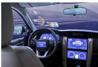
LED背光源和车内照明